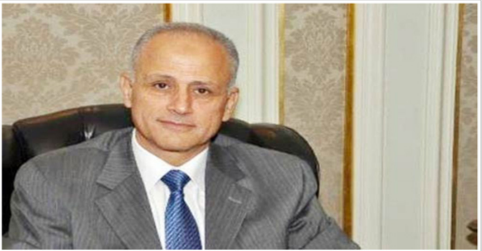
د. مصطفى مسعد وزير التعليم العالى