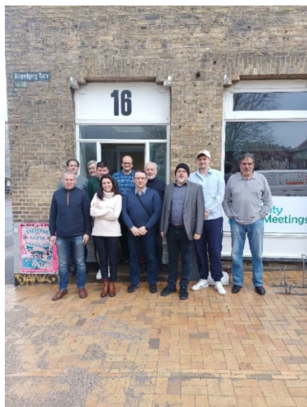
Riunione a Copenaghen