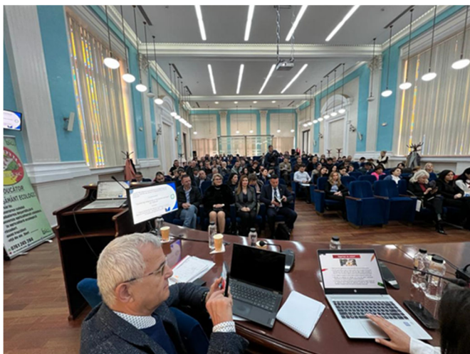
Forum regionale sull'innovazione, Università di Craiova, 27 febbraio 2023.