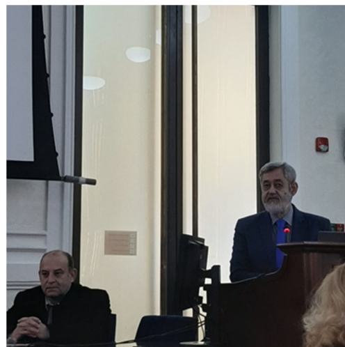
HUB - Centro di supporto per progetti internazionali di R&S per la regione di Oltenia, Craiova, 14 febbraio 2023